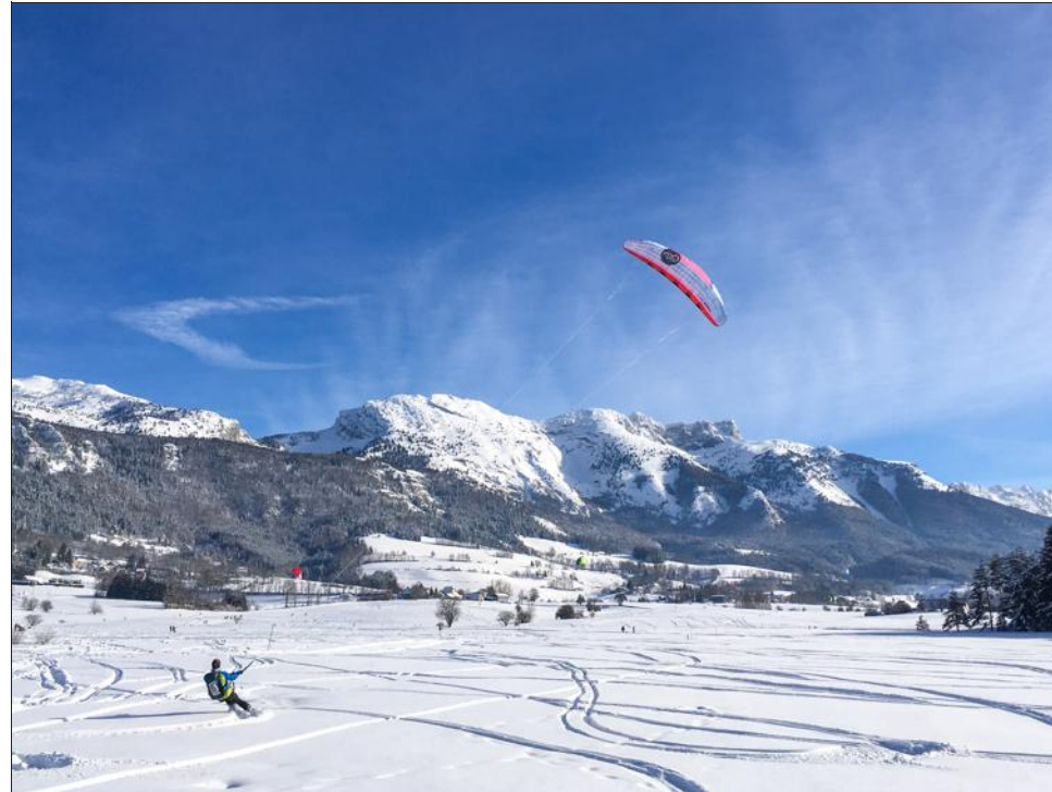
Un studio pour quatre personnes se loue entre 240 € et 350 € la semaine à Lans-en-Vercors, pendant les fêtes de fin d'année.

Qu'en est-il des Britanniques jusqu'ici très présents dans cette station de l'Oisans ? Début novembre, ils se faisaient encore attendre. « Je n'ai pas trop d'inquiétude pour les marchés proches, avance Jean-Jacques Botta, président de la commission location de vacances et immobilier de loisirs de la Fnaim au niveau national. Lorsque l'on interroge des tour-opérateurs, ils sont plutôt confiants. Le Benelux, la