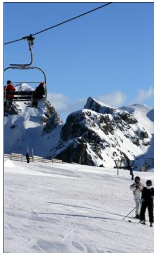
Beaucoup de touristes sont dans les starting-blocks pour retrouver les joies de la glisse, comme à Chamrousse.

Nombre d'agences proposent aussi des conditions d'annulation assez souples avec notamment la mise en place d'assurances complémentaires permettant l'annulation du séjour si le client contracte la Covid-19. « Cette réassurance des cli-