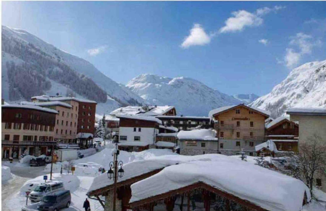
Val-d'Isère (Savoie). À plus de 12000 €/m 2 en moyenne, la station est la quatrième commune la plus chère de France.